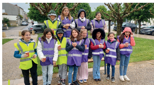
Conseil municipal des jeunes de Courçon

La commune de Marans propose également le "permis de végétaliser". Pour les habitants qui en font la demande, la commune désimperméabilise les pieds de façade et apporte de la terre.