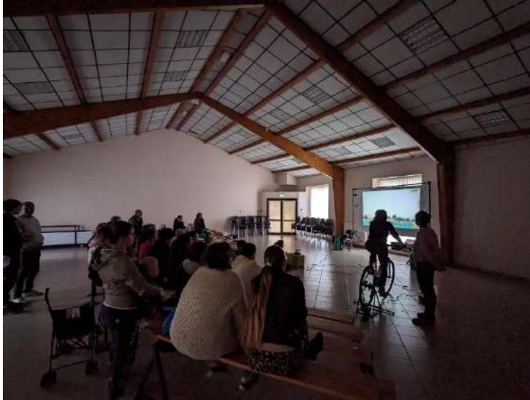
VENDREDI : Cram-Chaban Courts-métrages sur la nature

→ Une centaine de spectateurs sur l'ensemble des 3 soirées, 2 replis en intérieur à cause de la météo, 1 débat et des échanges importants après Les Roues de l'Avenir .