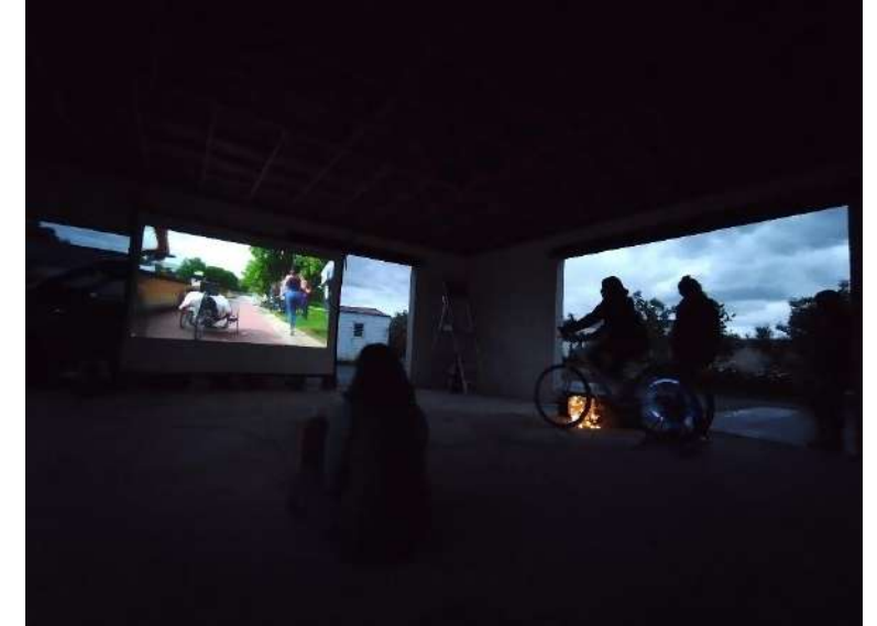
DIMANCHE : Charron Les Roues de l'Avenir

Plusieurs membres ont assisté aux soirées et les avis sont partagés. Le concept plaît mais les contenus ont déconcertés : les films pour enfant n'ont pas forcément semblé adaptés et Les Roues de l'Avenir donne envie de voir des films plus axés sur le milieu rural, car il est trop urbain pour notre territoire.