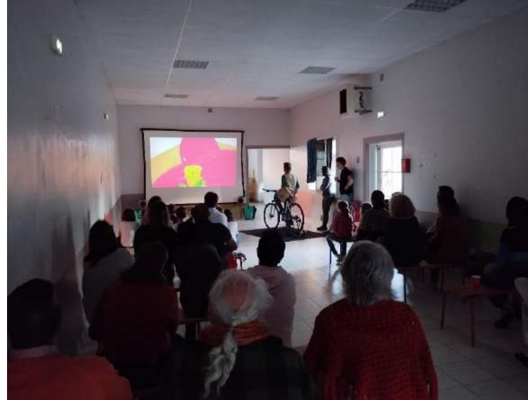
SAMEDI : Le Gué d'Alleré Courts-métrages jeune public