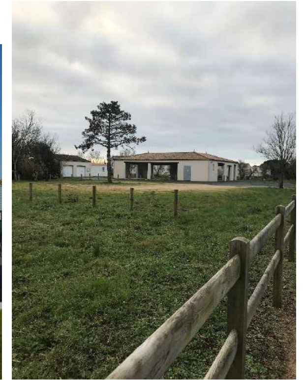
DIMANCHE : Charron Les Roues de l'Avenir

Les communes se chargent du fléchage, du boîtage de flyers, de l'animation avant la projection de cinéma en plein air et de la restauration sur place.