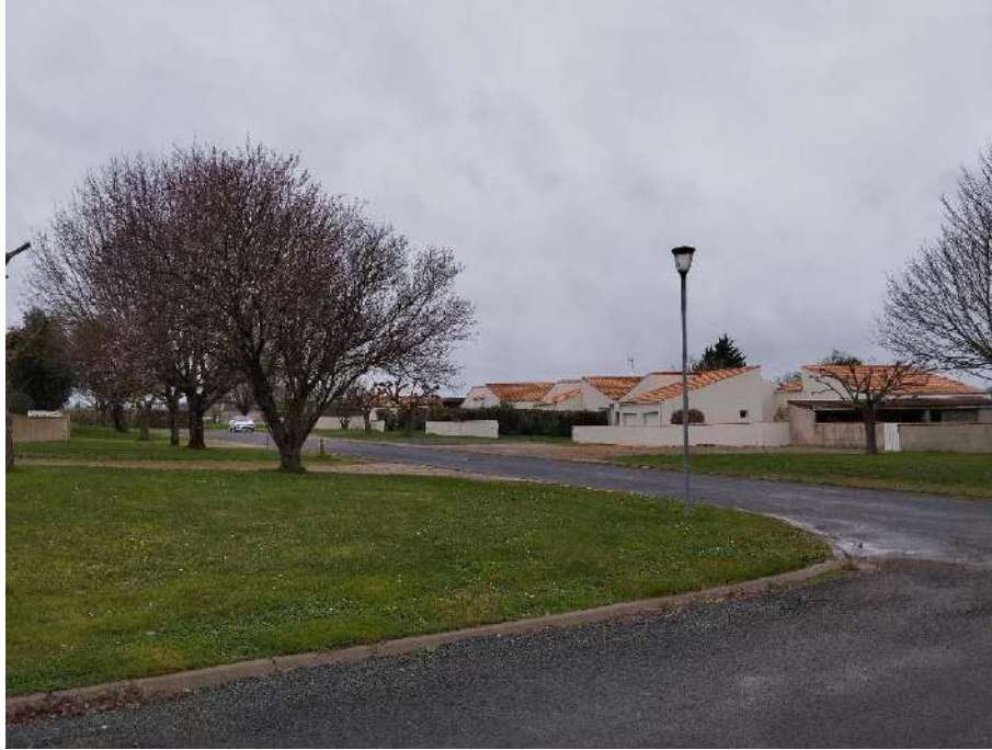
VENDREDI : Cram-Chaban Courts-métrages sur la nature

➤ Présentation du programme des 3 soirées → 17, 18 et 19 mai 2024