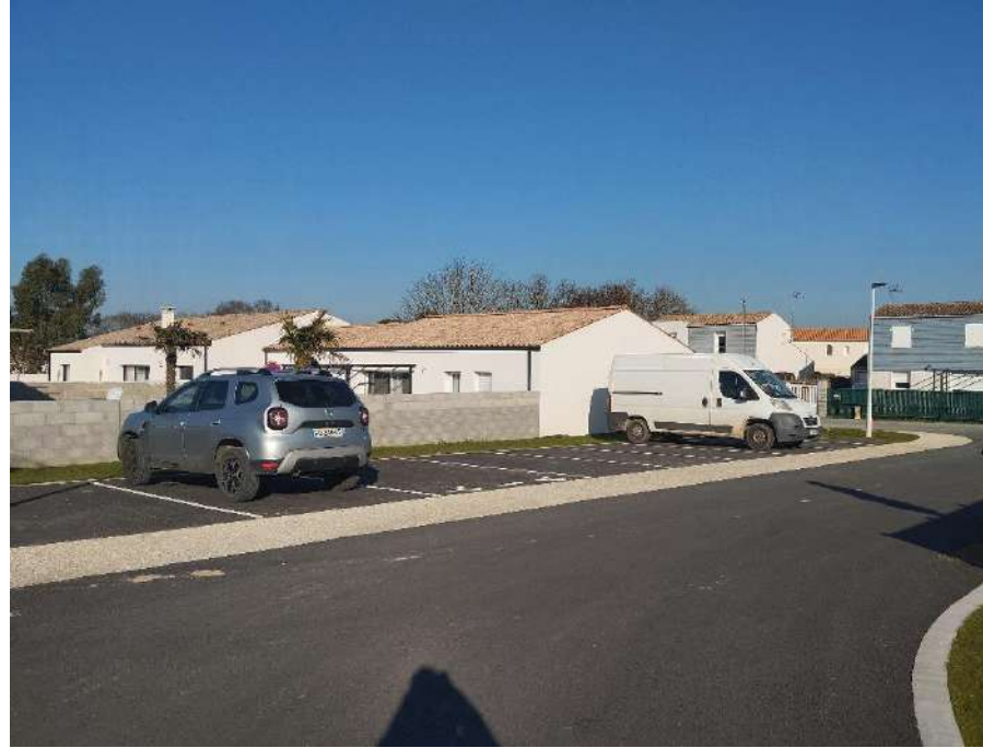
SAMEDI : Le Gué d'Alléré Courts-métrages jeune public